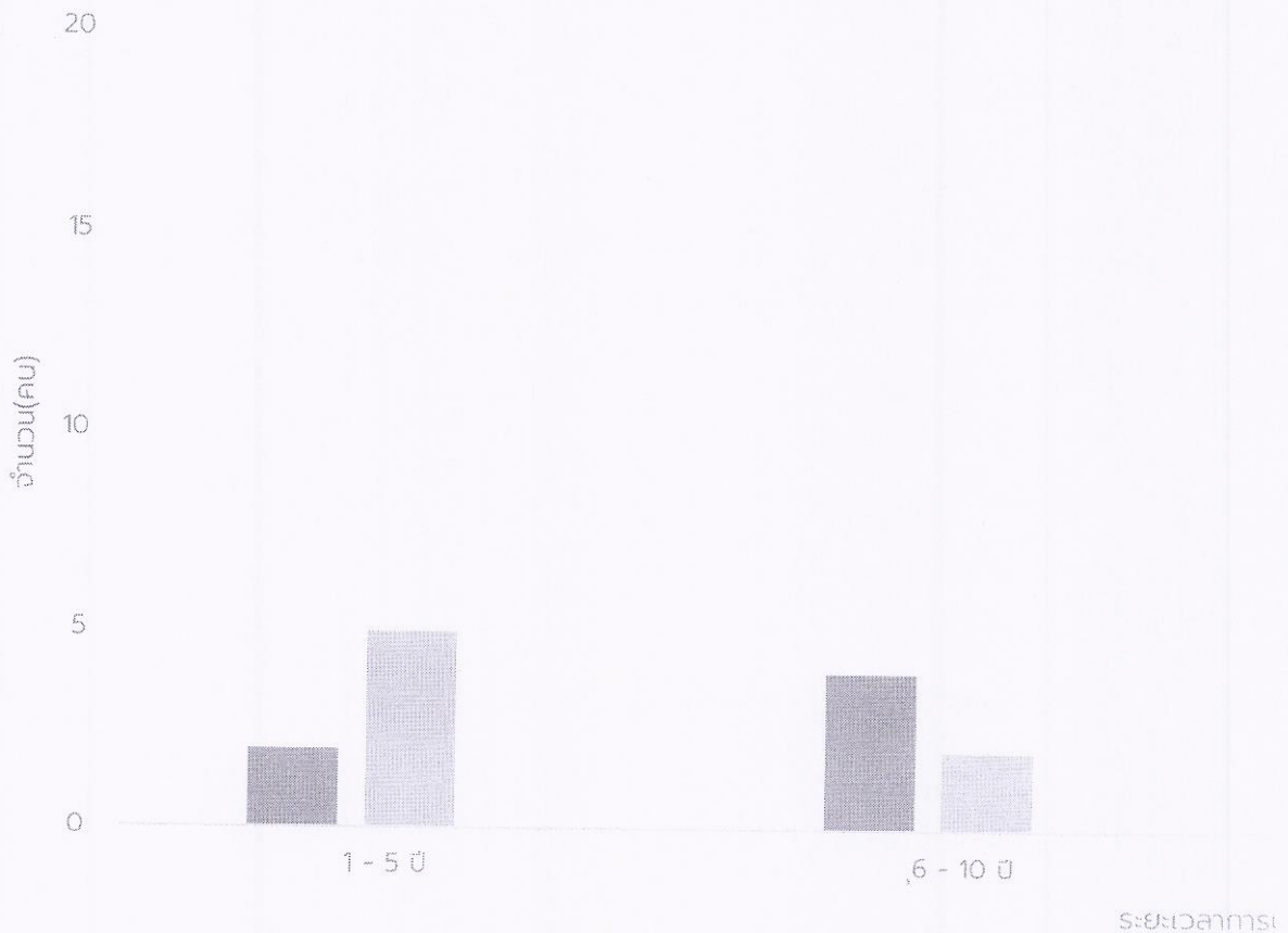
จำนวนบุคลากร